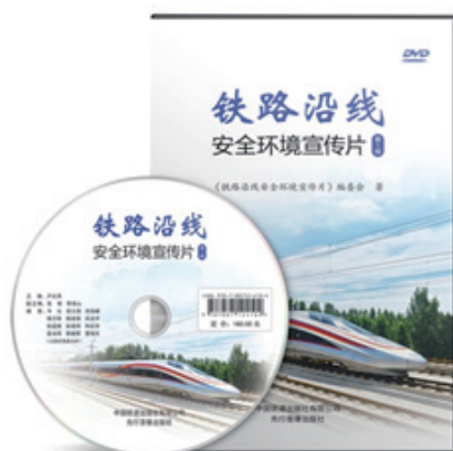
铁路沿线安全环境宣传片（第1辑）