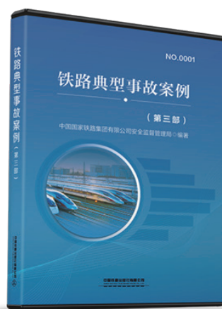
铁路典型事故案例（第三部）