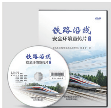
铁路沿线安全环境宣传片（第1辑）