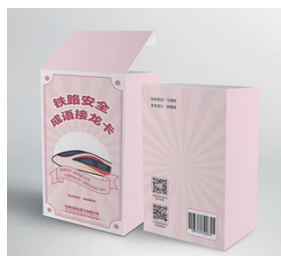
铁路安全成语接龙卡