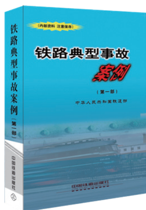
铁路典型事故案例（第一部）