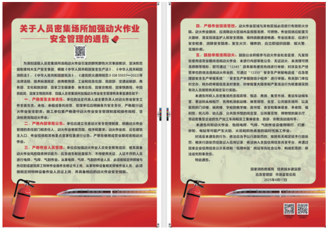
人员密集场所加强动火作业安全管理的通告