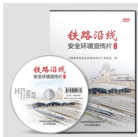
铁路沿线安全环境宣传片（第2辑）