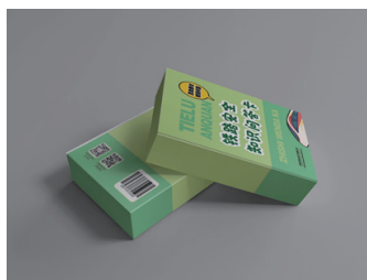
铁路安全知识问答卡

简介：本套成语接龙卡共 60 张，含 54 张成语卡、6 张万能卡（在接龙卡顿时使用万能卡，使用者可以获得重出新卡的机会以继续接龙），每张成语卡上都有印有包含该成语的爱路护路宣传语，方便使用者在游戏过程中学习爱路护路知识。