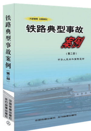
铁路典型事故案例（第二部）