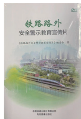
铁路路外安全警示教育宣传片