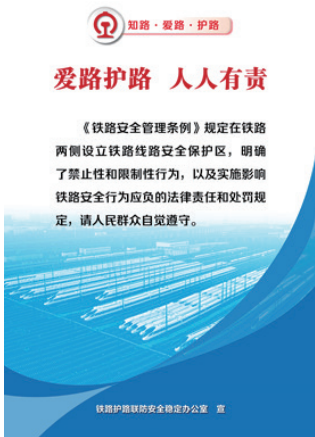
知路·爱路·护路系列宣传海报