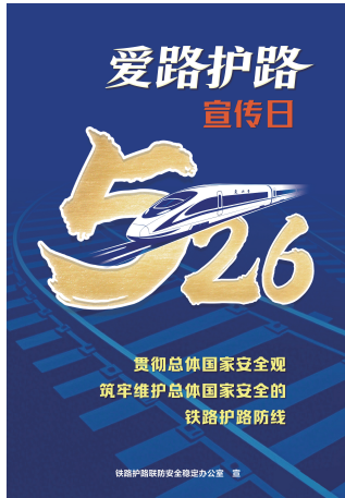
“5·26 我爱路”主题宣传海报