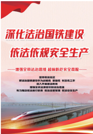
铁路安全法规宣传挂图